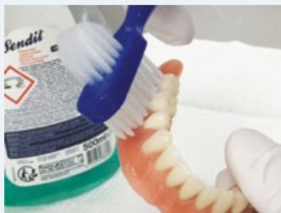
2-3 keer per dag reinigen met protheseborstel en zeep

Het is raadzaam de prothese 2 tot 3 keer per dag schoon te maken met een daarvoor bedoelde borstel en prothese reinigingsmiddel. Deze zijn bij de drogist te vinden. De prothese afspoelen nadat u iets gegeten heeft.