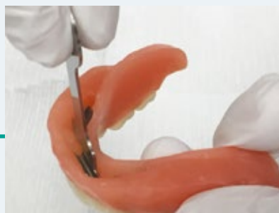
Behoud uw garantie en maak een afspraak