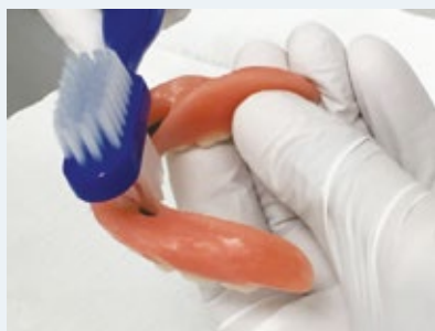
Reinig naast uw implantaten ook de binnenzijde